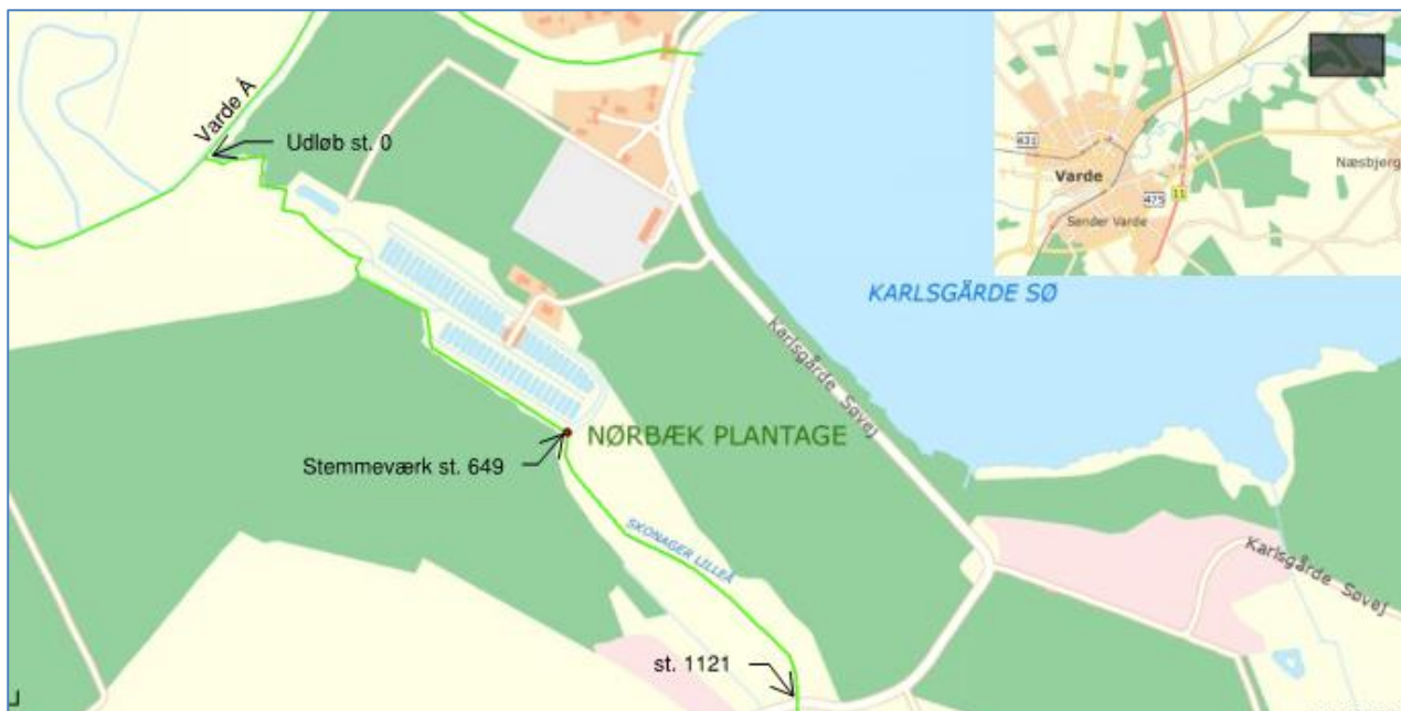
Fig. 1. Beliggenhed af Karlsgårde Dambrug. Målsætningen for Skonager Lilleå er god økologisk tilstand. DVFI 5 i forslag til vandplaner 2013.

Karlsgårde Dambrug er beliggende ved Skonager Lilleå umiddelbart inden udløbet i Varde Å.