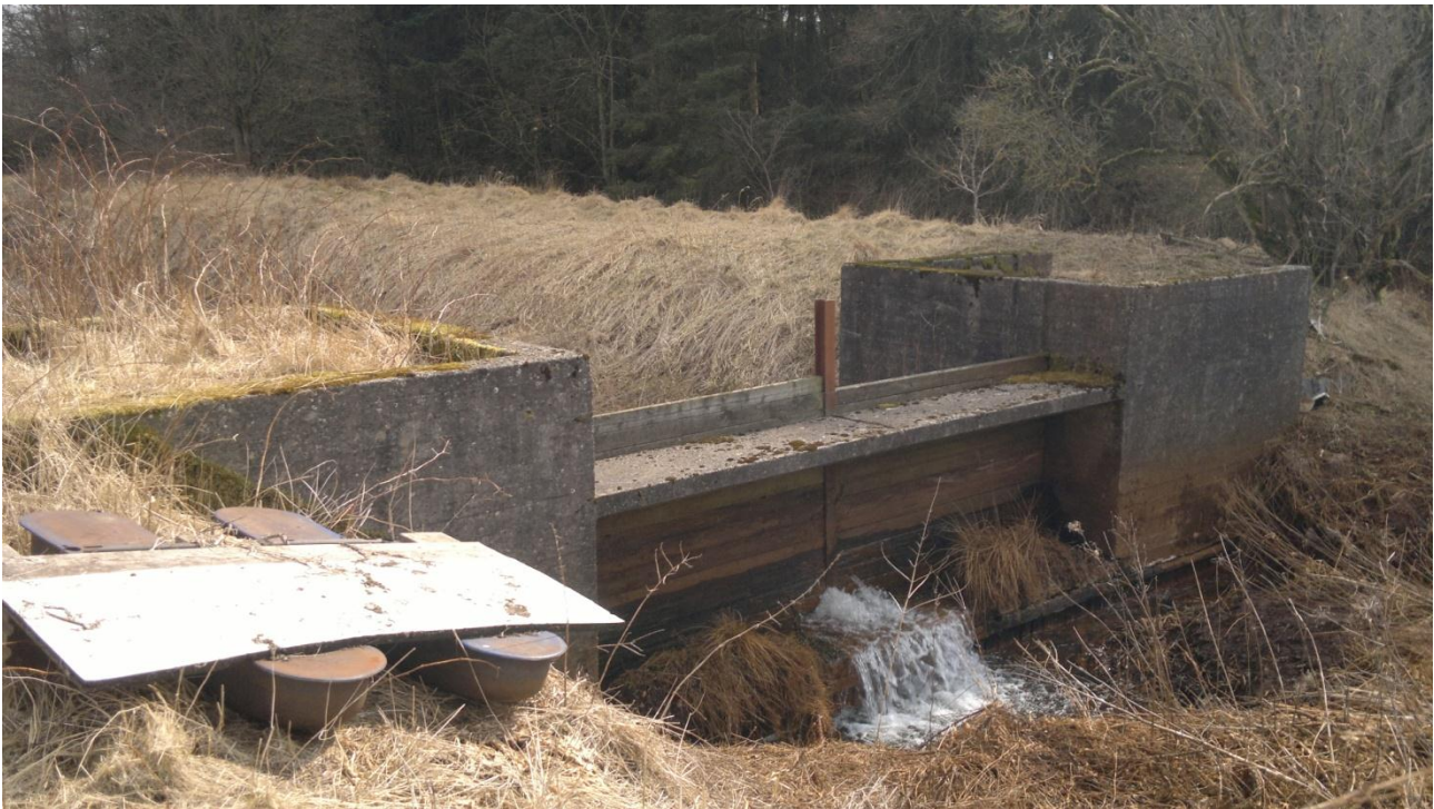
Fig. 10. Udløbsbygværk fra bagkanalen. Vandet løb direkte i Skonager Lilleå herfra, før der blev stillet krav om rensning af vandet ved bundfældning.