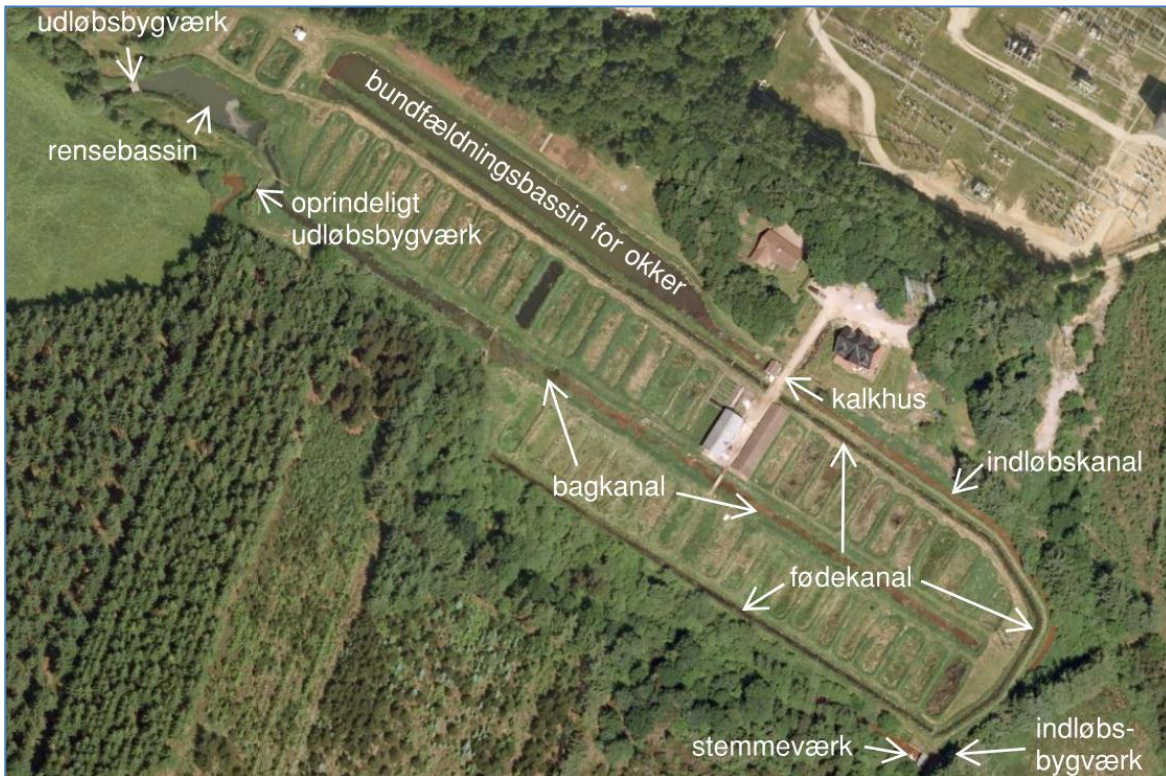
Fig. 3. Oversigt over dambrugets indretning

Dambruget er traditionelt opbygget - dog med et stort bundfældningsbassin for okker - efter tilsætningen af hydratkalk. Okkerfjernelsen har sandsynligvis været nødvendig for opretholdelse af en produktion i dambruget. For enden af bagkanalen findes det oprindelige udløbsbygværk fra før der blev krævet rensning af udløbsvandet ved bundfældning.