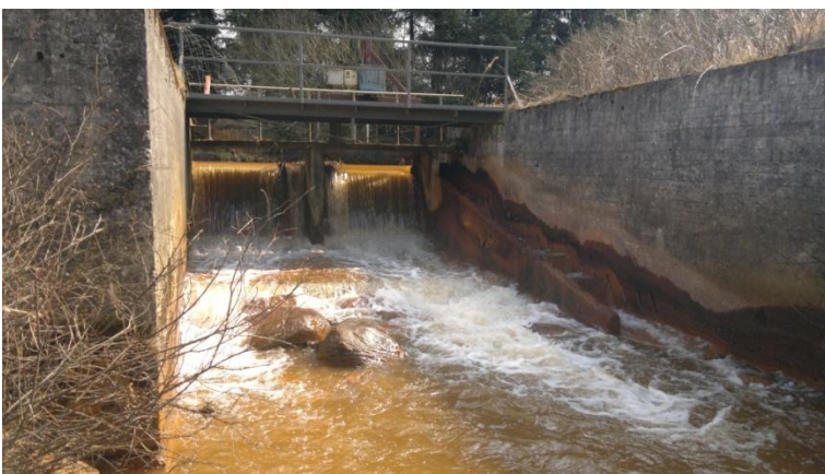
Fig. 4. Det eksisterende stemmeværk er et stort solidt bygværk med et vandslug på ca. 4,2 m og ca. 0,8 m til en fisketrappe. Vandets okkerbelastning er tydelig.

Stemmeværket har en bredde på ca. 5 m. og et vandspejlsfald på ca. 2 m. Der er en kammertrappe i stemmeværkets sydside.