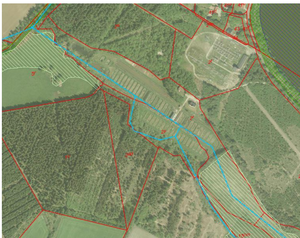
Fig. 11. Matrikelkort og kort over § 3 beskyttet eng (lyst skraverede felter) og § 3 beskyttet vandløb (lyseblå stiptet)

Skonager Lilleå og dambrugets bagkanal er udpeget som § 3 beskyttede vandløb jf. Naturbeskyttelsesloven. Det forventes dog, at Varde Kommune kan opnå dispensation fra § 3 til det foreslåede projekt.