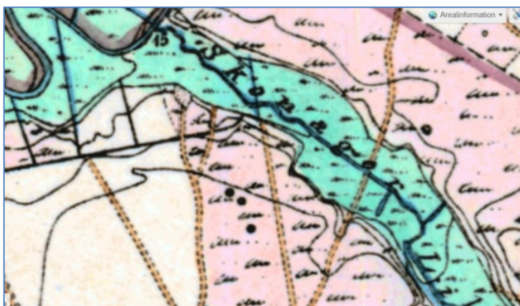
Fig. 2. Forløbet af Skonager Lilleå gik tidligere, hvor dambrugets bagkanal befinder sig i dag. Forløbet var også tidligere forholdsvis retlinet.

I en rapport over Pilotområde Skonager Lilleå 1 er det oplyst følgende om jernindholdet i Skonager Lilleå: