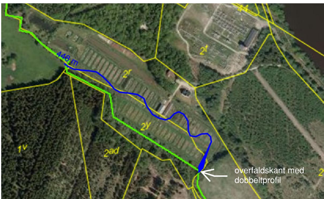
Fig. 8. Forslag til forløb af stryget på det nedlagte dambrug. Dambrugets ejere har været hørt forlods om forløbet af det slyngede forløb.

Eventuel overskudsjord/humusjord, der ikke kan benyttes som underlag for stryget, forventes anbragt i en eller flere damme på dambruget. Det eksisterende vandløb nedstrøms stemmeværket og indtil sammenløbet bevares, men nedklassificeres til privat vandløb.