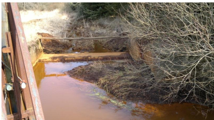
Fig. 5. Indløbsbygværket til dambruget er ca. 4 m bredt.

Regulativet for Skonager Lilleå er et styrekote-regulativ, og det er derfor ikke umiddelbart muligt at fastsætte nogle dimensioner på vandløbet. Der skal under en bestemt kote være et minimumsareal til stede til at føre vandløbets afstrømning. Et areal på 4,5 m 2 kan dog f.eks. beskrives ved 1 m vanddybde, en bundbredde på 3,5 m og anlæg 1:1.